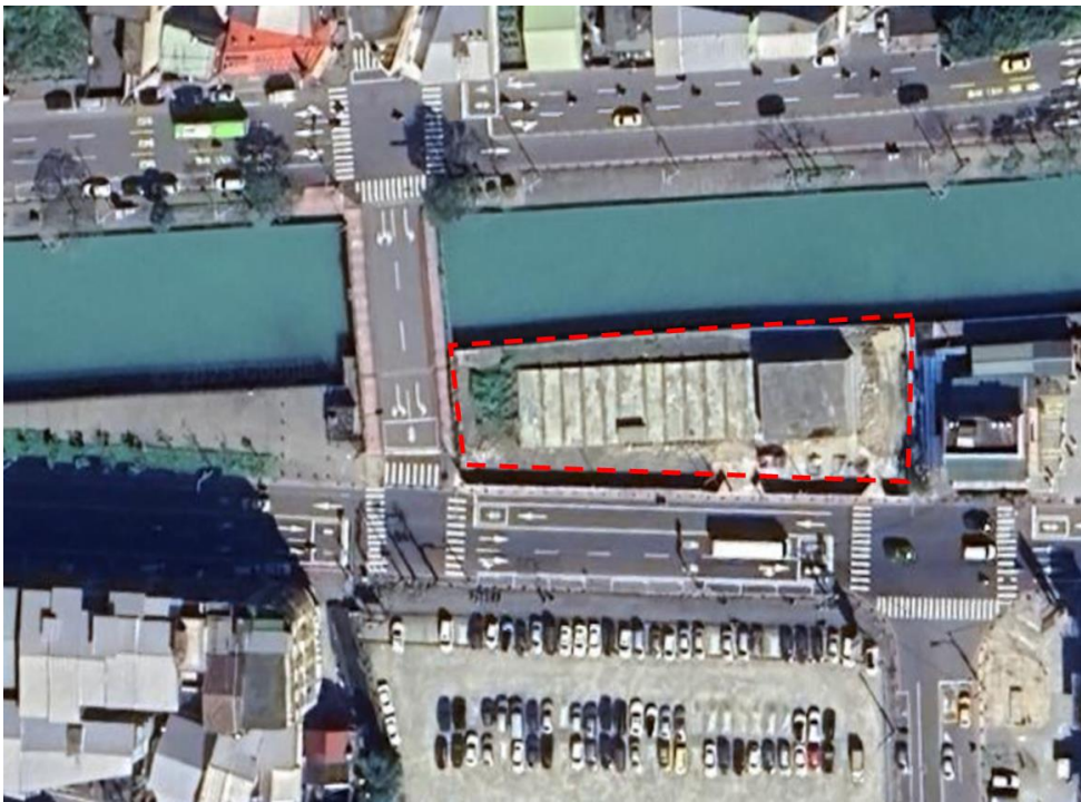
圖 2.1 田寮河基地位置